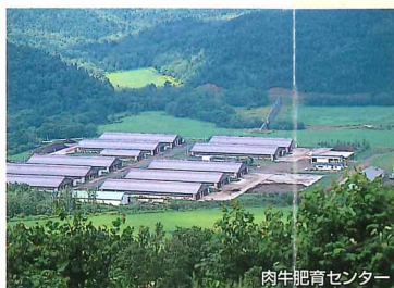
肉牛肥育センター

生産性の向上と付加価値を高める農業技術センター、地場産品開発研究センターをはじめ、2000頭規模の肉牛飼育センター、労働力の省力化と規格外カボチャの付加価値を高めるカボチャ選別加工工場など21世紀の新しい農業を目指して設備の充実を図っています。