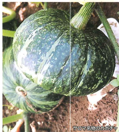
サロマ名物のカボチャ