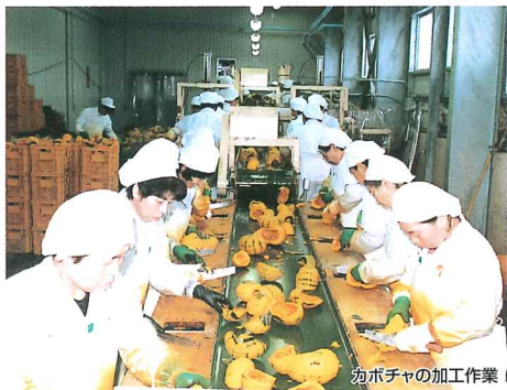
カボチャの加工作業