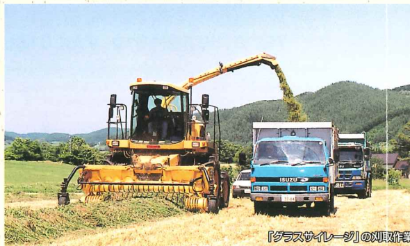
「グラスサレージ」の刈取作業