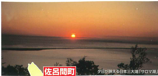
夕日が映える日本三大湖「サロマ湖」