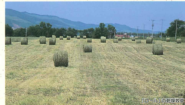
「ロール」の乾燥牧草