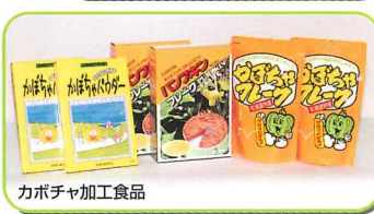
カボチャ加工食品