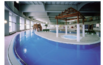
音更町温水プール アクリナチャッポ