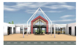
道の駅 おとふけ「なつぞらのふる里」