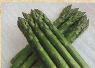
全国でも珍しい道内屈指の春夏秋冬アスパラガス生産町